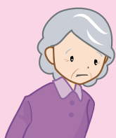
(85歳 女性 要支援2)

一人暮らしをしていて、時々いろいろなことで不安になる。些細なことでも気軽に相談できる相手がほしい。