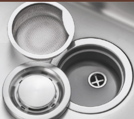
ステンストラップ (ステンレスプレート・カゴ付)

交換後も配管の定期清掃(高圧洗浄)が可能です 雑排水管清掃の際、挿入口はシンク下の★排水トラップ 点検口からとなります。